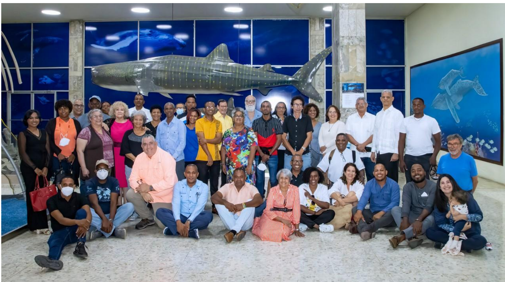
Asamblea ordinaria de miembros de Grupo Jaragua, diciembre 2021.