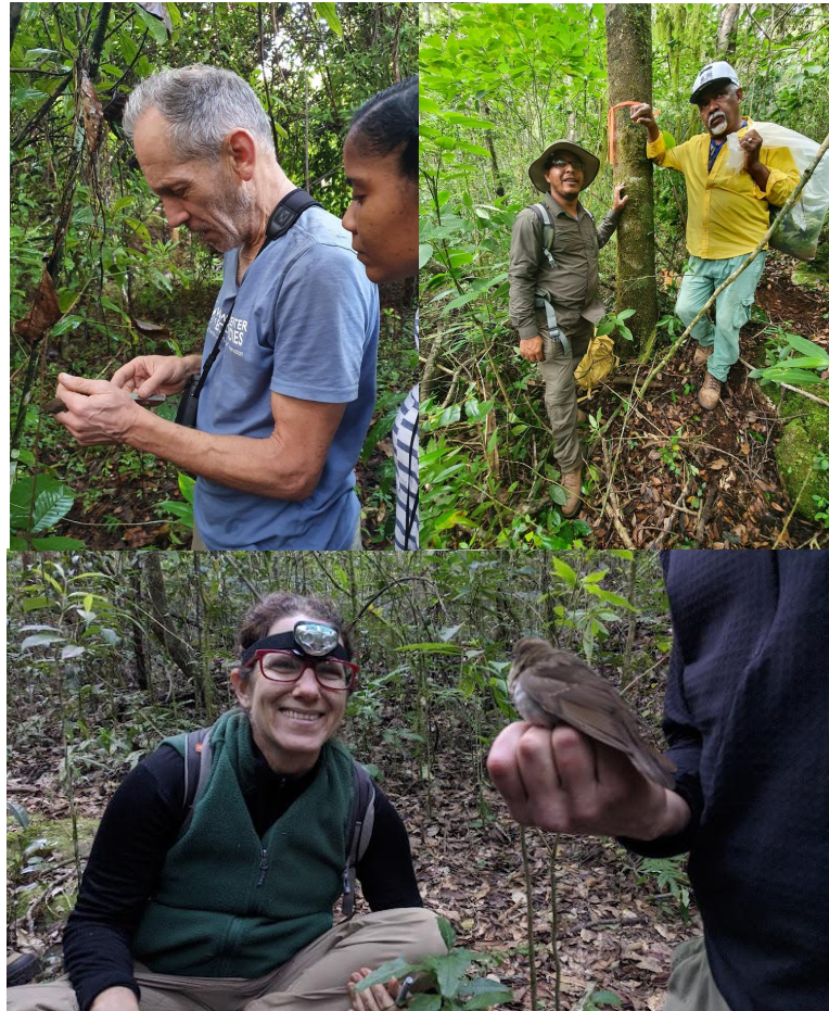
Levantamientos de monitoreo del zorzal de Bicknell y su hábitat en el Parque Nacional Sierra de Bahoruco.

En 2022 mantuvimos el monitoreo del anidamiento de la iguana de Ricord ( Cyclura ricordii ) en Los Olivares de Pedernales, el sur del Lago Enriquillo, y Anse-a-Pitres (Haití). Mediante visitas presenciales, dimos seguimiento al monitoreo de anidamiento de tortugas marinas en las playas del Parque Nacional Jaragua (Mosquea y Bahía de las Águilas) y realizamos un levantamiento de tortugas juveniles en el arrecife de Bahía Honda (Pedernales). También, realizamos una visita de toma de datos morfométricos de la jicotea sureña ( Trachemys decorata ) en la Laguna Cabral.