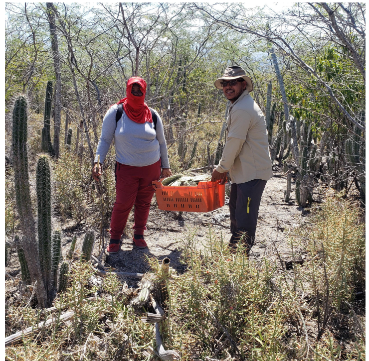
Jornadas de restauración del bosque seco en el Corredor Biológico La Florida (Independencia).