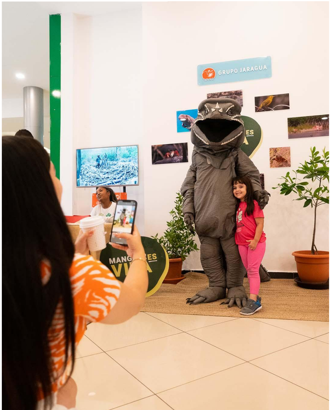
Stand interpretativo y exposición fotográfica "Manglar es Vida" presentada e inaugurada durante la "Semana MANGLARES" en Galerías 360, Santo Domingo.