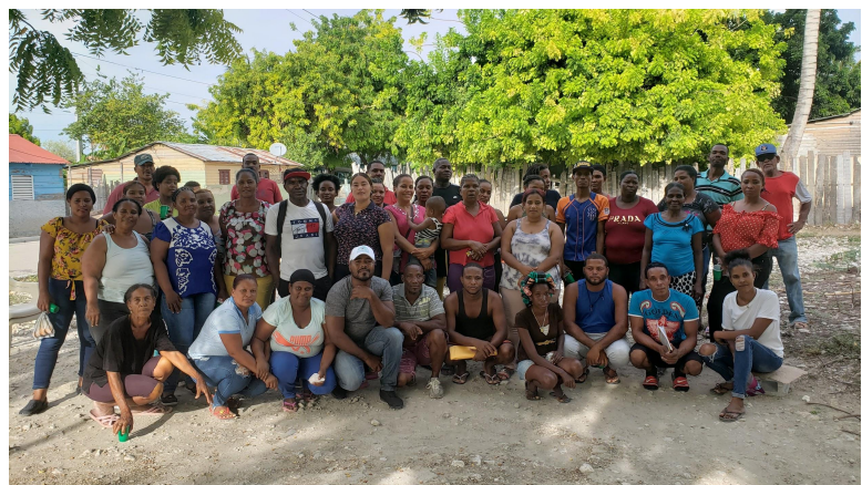
Taller comunitario en Las Baitoas (Independencia) sobre medios de vida sostenibles y restauración del bosque seco.

Con el objetivo de promover medios de vida sostenibles vinculados a la conservación de bosques húmedos, sostuvimos diversas reuniones con el Consorcio Ambiental Dominicano (CAD) y otros actores para identificar oportunidades de promover el sendero de aviturismo “James Bond” en la Reserva Privada Zorzal (Duarte). También, iniciamos la elaboración de una guía de recomendaciones para la producción de cacao “amigable a las aves.”