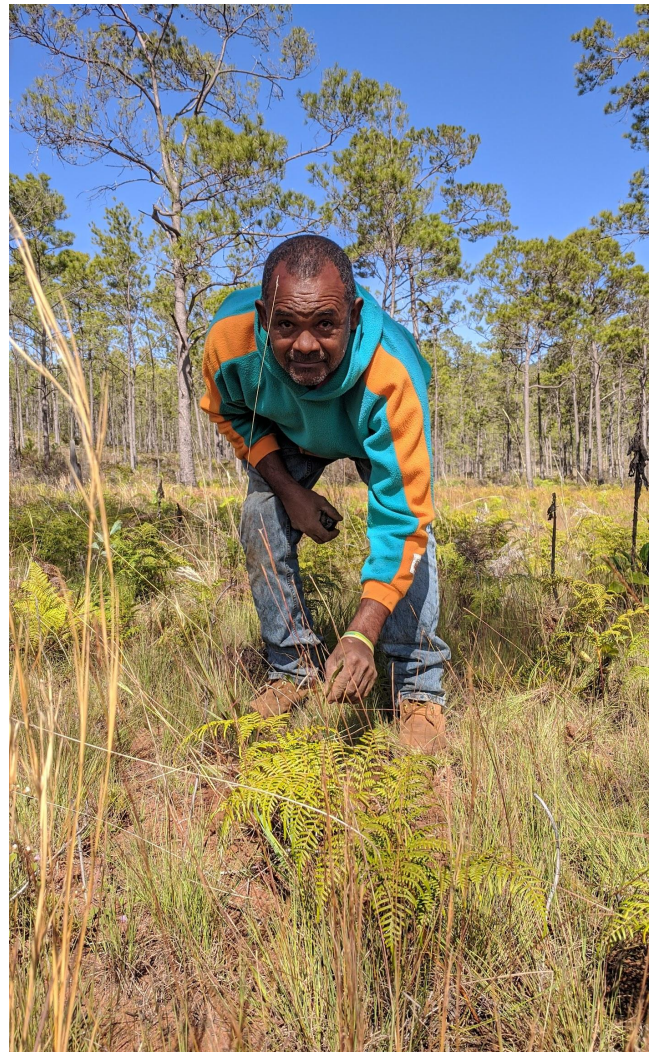
Piloto de restauración del bosque húmedo en el Parque Nacional Sierra de Bahoruco,

El programa de conservación de bosques montanos fue fortalecido mediante la sinergia entre varios proyectos de investigación, restauración ecológica y manejo efectivo. Continuamos con el manejo activo de 144 hectáreas de bosque húmedo y mixto en los terrenos adquiridos en la zona sur del Parque Nacional Sierra de Bahoruco. Realizamos con un piloto de restauración en sitios degradados por deforestación e incendios forestales, incluyendo acciones de bombeo de semillas, control de plantas invasoras y reforestación con plantas nativas como la manacla ( Prestoea acuminata ), el almendrillo ( Prunus mirtifolia ) y la cigua ( Nectandra hihua ). Para complementar estos esfuerzos, realizamos un estudio sobre la regeneración natural del bosque post-incendio y un análisis espacial para documentar los sitios más vulnerables.