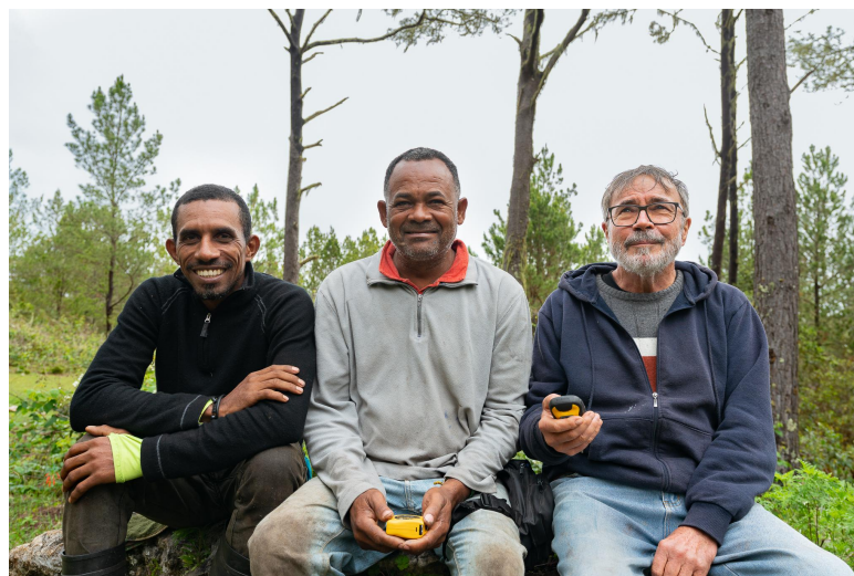
Equipo de monitoreo del diabloteño en el Parque Nacional Sierra de Bahoruco.