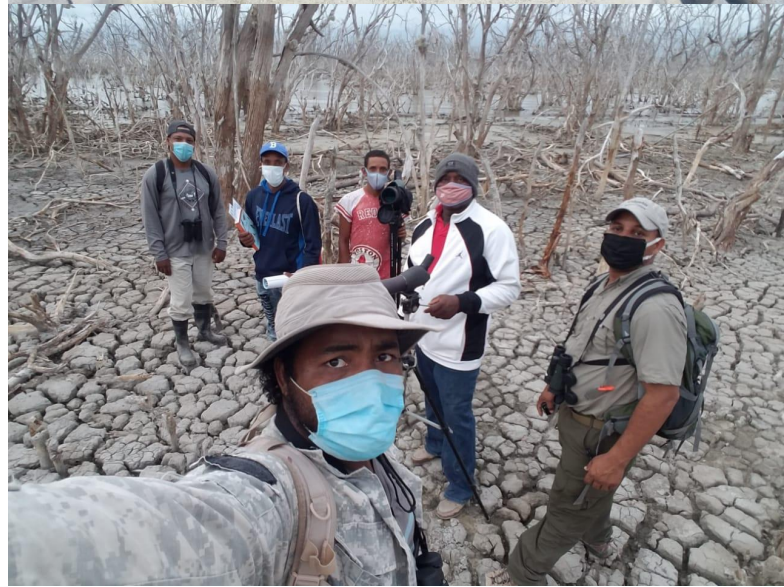
Monitoreo de humedales clave y amenazas en la región Enriquillo.