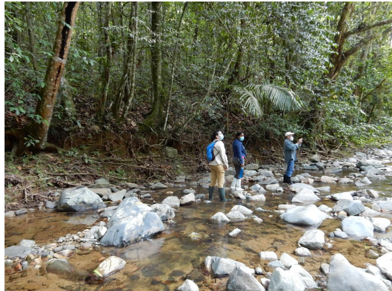
Establecimiento de sendero de aviturismo en la Reserva Privada Zorzal (Duarte) junto a Consorcio Ambiental Dominicano.