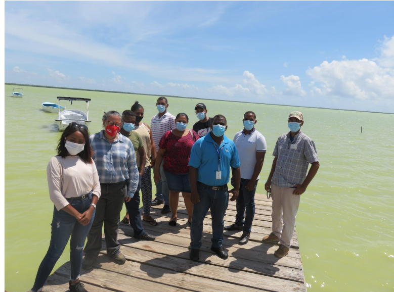
Taller comunitario sobre medios de vida sostenibles y ecoturismo de manglares en la Laguna de Oviedo (Pedernales).