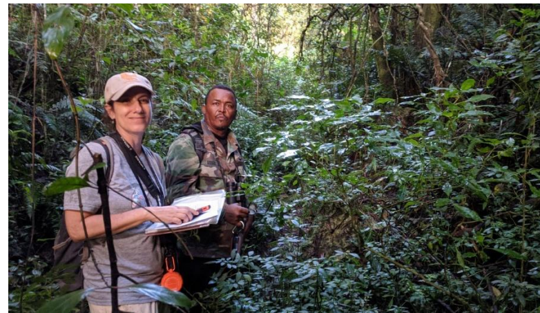
Monitoreo del zorzal de Bicknell ( Catharus bicknelli ) en la Sierra de Bahoruco.