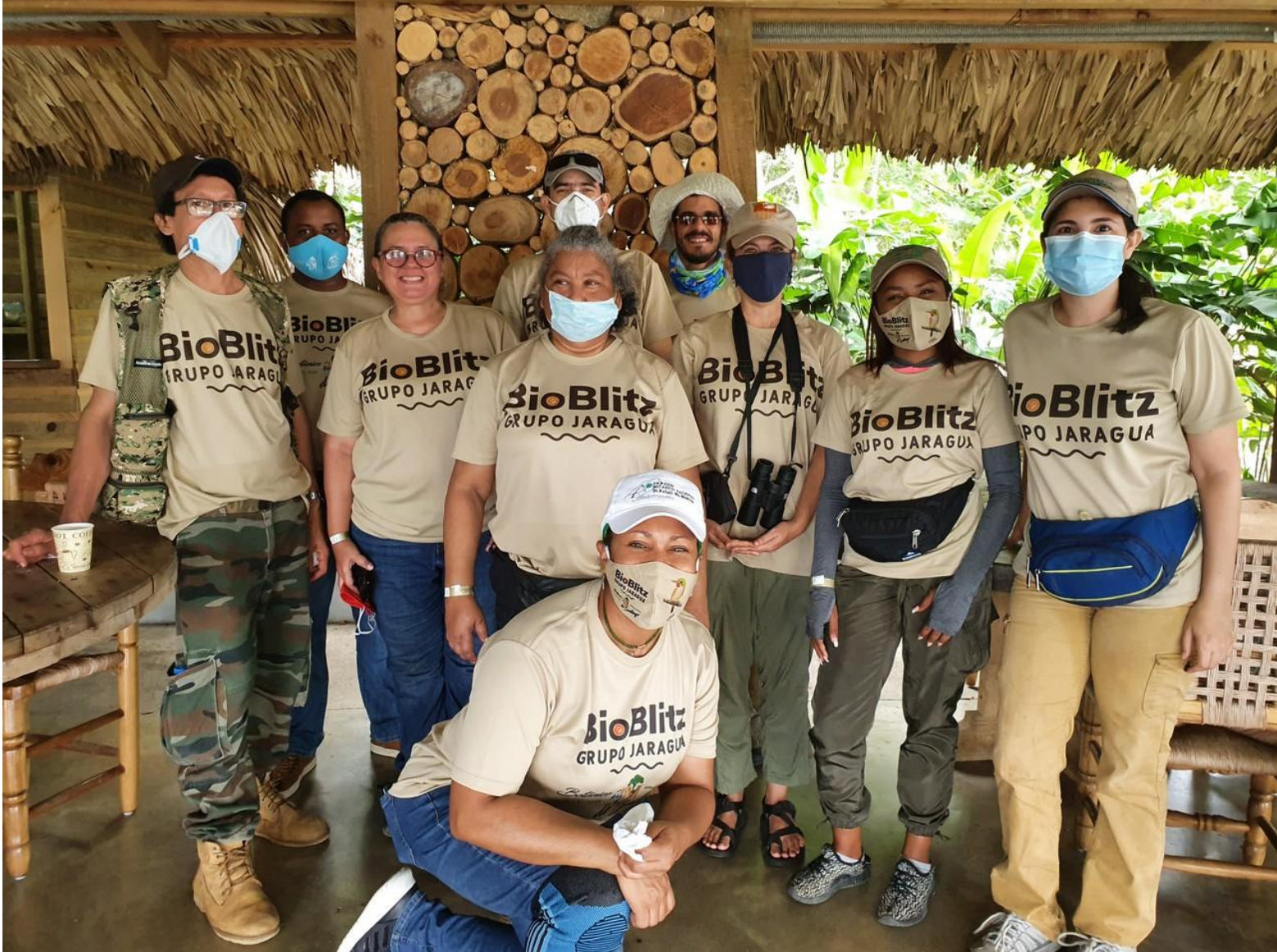
Actividad de ciencia ciudadana "Bioblitz" con medidas de bioseguridad realizada para el público general en el Jardín Botánico de Santiago Profesor Eugenio de Jesús Marcano Fondeur, Santiago (14 de noviembre).