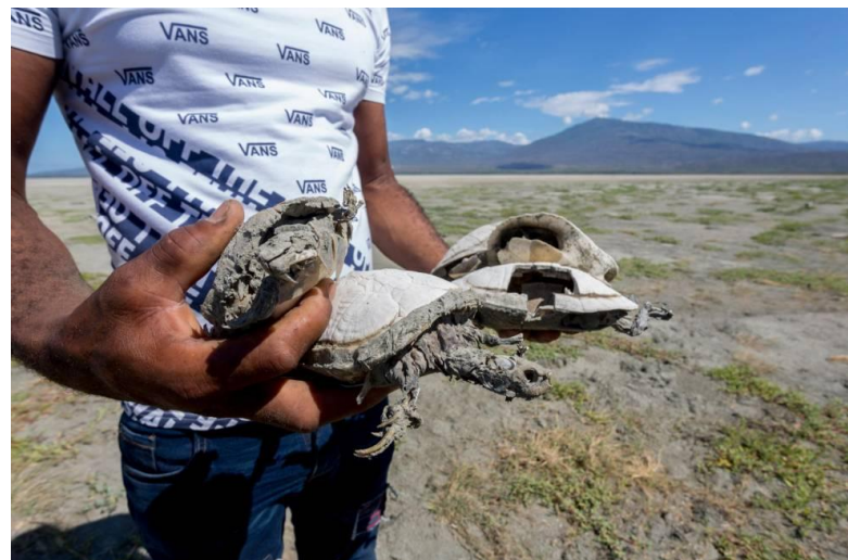
Foto-documentación de impactos de la sequía extrema en la Laguna Cabral.