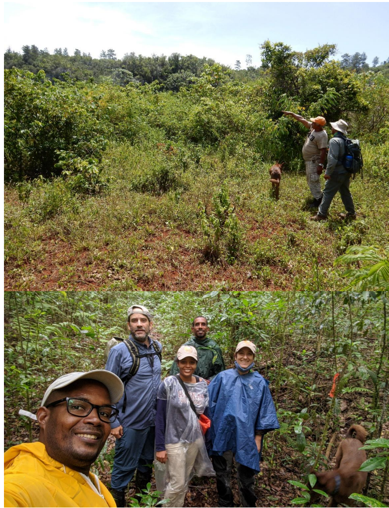
Levantamientos de biodiversidad en terrenos adquiridos en el Parque Nacional Sierra de Bahoruco.

Entre los hitos del programa de conservación del bosque montano, iniciamos el proceso de planificación para la restauración de nuevos terrenos adquiridos en la zona sur del Parque Nacional Sierra de Bahoruco. En la zona de amortiguamiento del Foret-des-Pins (Haití) se realizó una jornada de reforestación con pino criollo ( Pinus occidentalis ) de 20 hectáreas degradadas.