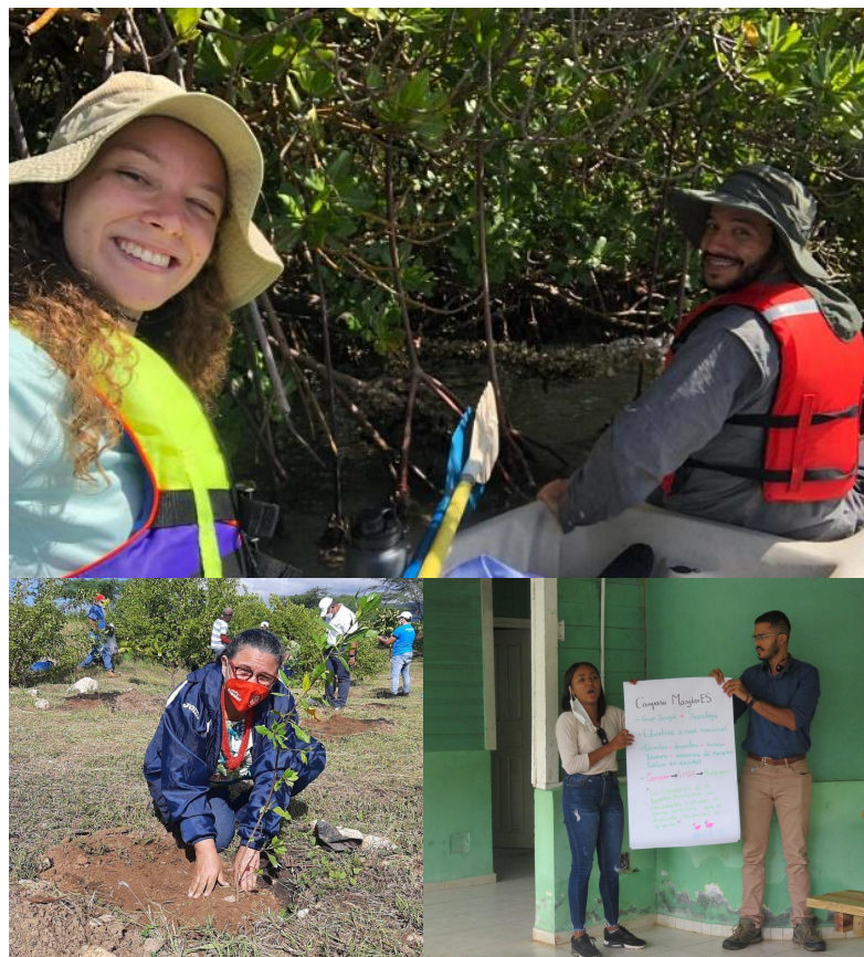
Primeras actividades de la campaña educativa nacional “MANGLARES.”

gráfica y diseñamos un plan de comunicación con el equipo de Cúa Conservation Agency con la finalidad de fortalecer el uso de nuestras redes sociales y la página web. También, comisionamos la elaboración de nuevos artes, y la toma de materiales audiovisuales sobre los manglares y su biodiversidad asociada. A pesar del cierre parcial del año escolar, las restricciones de agrupamiento en sitios públicos, y la transición a las clases virtuales debido a la pandemia del COVID-19, logramos realizar acciones divulgativas en 6 provincias a nivel nacional.