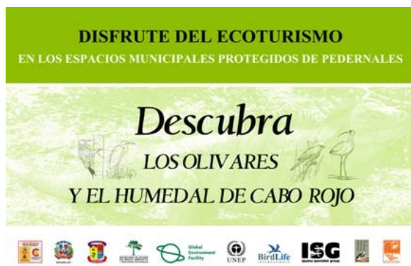
Cartel de interpretación del Espacio Municipal Protegido de Los Olivares, Provincia Pedernales, República Dominicana

Los Olivares alberga una población importante de la Iguana de Ricord ( Cyclura ricordi ) endémica de la Región Suroeste del país y en la actualidad considerada especie en Peligro Crítico de Extinción (CR) por la Unión Mundial para la Naturaleza (UICN).