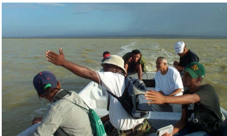
Guías de la Naturaleza en una excursión interpretativa de la Laguna de Oviedo.

412-1667 o llámenos al (809) 472-1036 en Santo Domingo. En el Municipio de Oviedo contacte a Olga Vidal al (809) 343-9113.