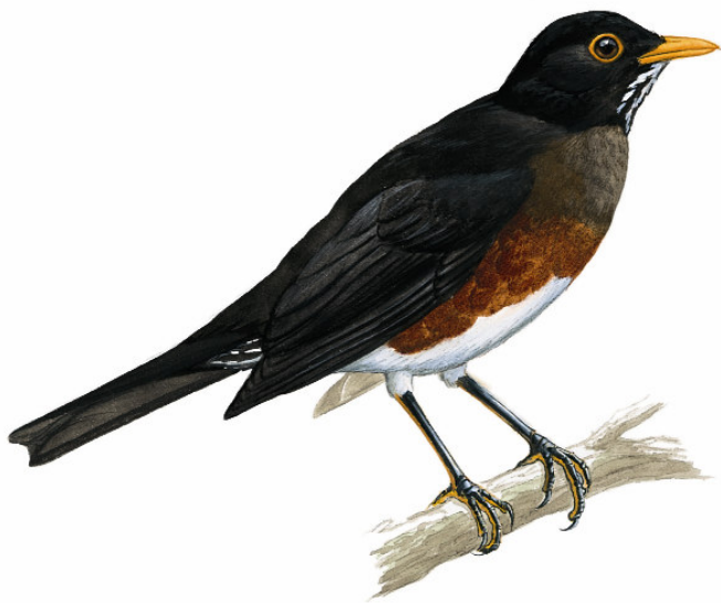
El Zorzal de la Selle ( Turdus swales ) es un ave que necesita acciones urgentes de conservación a nivel local, sobre todo en la región suroeste del país

El Grupo Local de Apoyo, es una importante herramienta de defensoría de los sitios que no puede ser ignorada por los tomadores de decisiones en cualquier nivel. Los GLA usan las aves como un medio para llamar la atención y estimular el interés por la biodiversidad local.