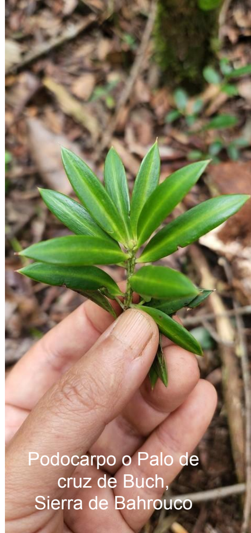
Podocarpus o Palo de cruz de Buch, Sierra de Bahrouco

Ayudar al desarrollo de planes de acción de conservación y a actualizar la lista roja nacional así como la lista roja de la UICN