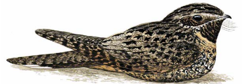
Pitanguá ( Caprimulgus ekmani )